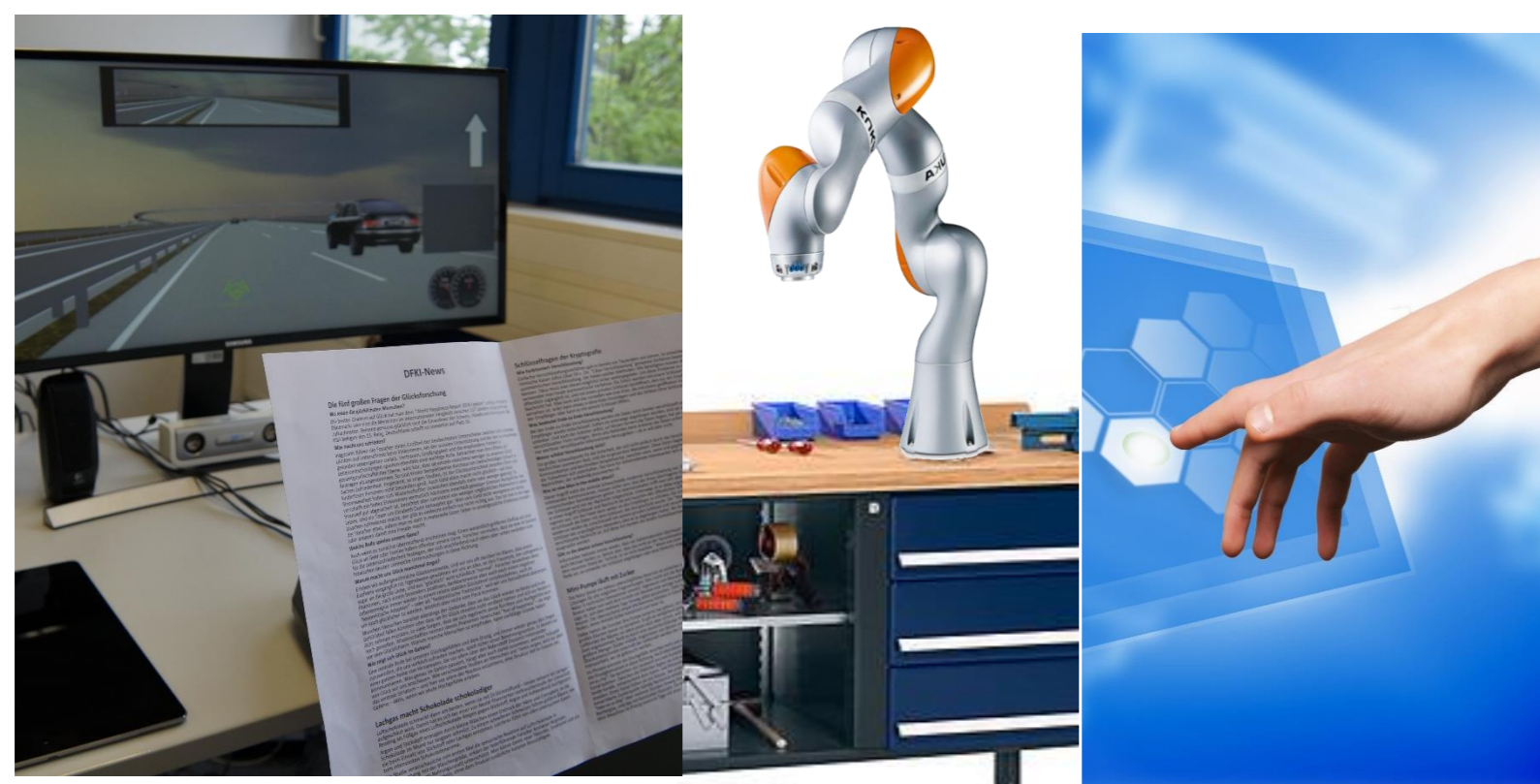
Kontrollübergabe im Fahrzeug und bei MRK, berührungsfreie Gesten

Am Standort Saarbrücken werden ML-Techniken sowohl unter dem Aspekt der multimodalen, proaktiven und situationsbewussten Assistenz und Interaktion mit dem Menschen betrachtet, bei denen diese Techniken unter anderem zum Erlernen adaptiver Verhaltensweisen, zur Vorhersage von Benutzerverhalten oder zur Optimierung von Systementscheidungen und -empfehlungen eingesetzt werden. Diese Interaktion stellt herausfordernde Anwendungsfälle für Machine Learning bereit. So muss die Kontrollübergabe sicher sein und das Vertrauen in die Technik fördern. Lernende Interaktion, Prognoseverfahren im Industriekontext sowie digitale Mensch-Modelle werden als Lerninhalte aufbereitet.