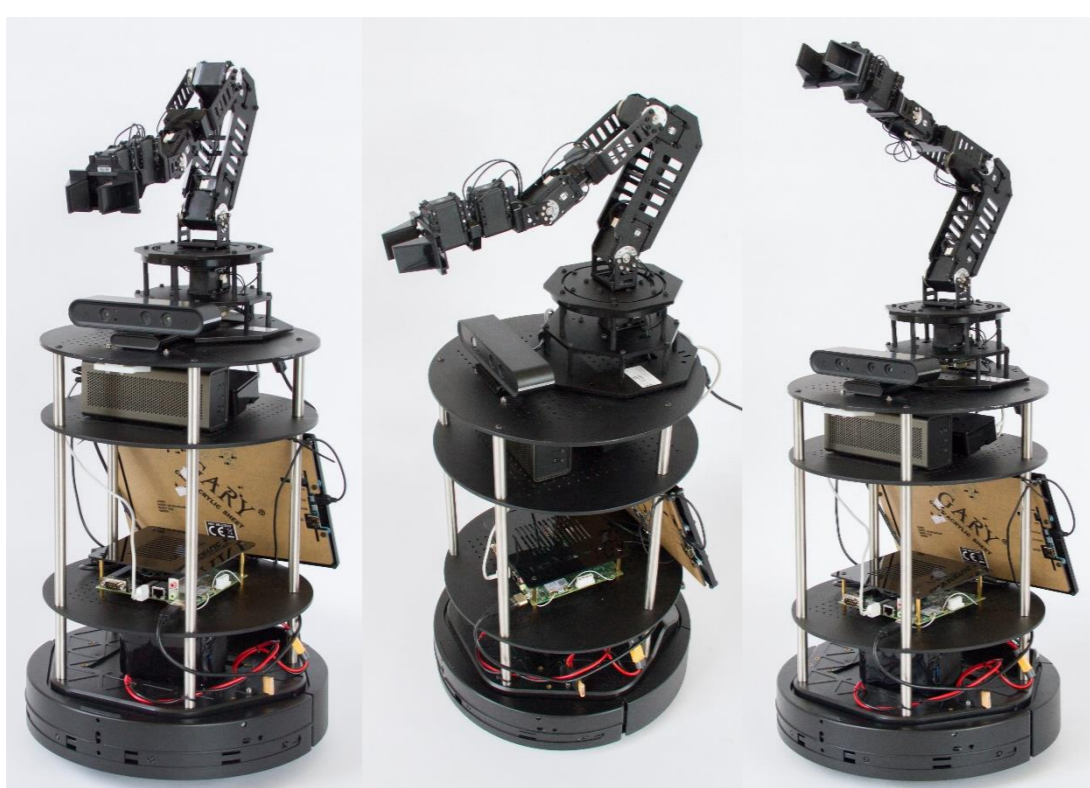
Individualisierte Turtlebot-Systeme für Anwendungen des Langzeitlernens

Am Standort Bremen werden vor allem Fähigkeiten im Bereich Robotik geschult. Eine individualisierte, kommerzielle mobile Plattform wird Sensordaten durch ML-Verfahren verarbeiten und entsprechend sein Verhalten anpassen. Die erarbeiteten Konzepte und Grundlagen können anwendungsnah im Produktionsszenario mit industriellen Manipulatoren evaluiert werden. Zentrale Themen sind Verhaltensoptimierung durch ML, Langzeitautonomie durch flexible ML-Verfahren, Selbstevaluation und -regulation, Test und Evaluation von Lernverfahren auf den mobil-autonomen Systemen. Hierbei soll den Systemen größtmögliche Autonomie (Explorationsverhalten) bei der Ausübung von Verhalten (Greifmanipulationen) überlassen werden.