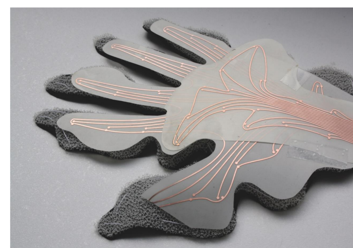
Prototypische Umsetzung von Wearables und IoT

Am Standort Berlin werden mit den Methoden der interdisziplinären und partizipativen Design-Forschung anwendungsnahe Konzepte rund um die Mensch-Maschine-Interaktion mit smarten Textilien und soften Interfaces entwickelt. Die Beteiligten lernen dadurch nicht nur einen nutzerorientierten Entwicklungsprozess kennen, sondern tragen auch aktiv dazu bei, interdisziplinär entstandene Forschungsmuster zur Datenerhebung zu gestalten. Das Berlin Open Lab wird hierfür als Experimentierraum für die neuen Lehr- und Lernformate dienen und eine Reflektion von Wearables und IoT ermöglichen wie auch die Problematik der Datenanalyse und Mustererkennung bei textilen Sensoren thematisieren.